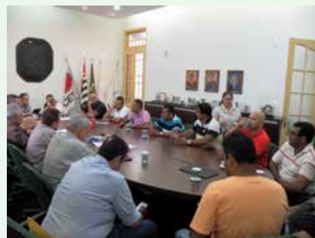
Grupos que tratam de Seguros, Negociações Trabalhistas e Transporte Local já realizaram encontros no sindicato

Uma das principais propostas da nova diretoria do Sindisan, a criação de Câmaras Temáticas para a discussão de assuntos já está em vigor.